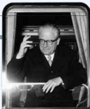
Giovanni Gronchi, Presidente della Repubblica

1 obbligatoria l'iscrizione per tutti i lavoratori ai quali viene applicato il CCNL 2 e quindi garantita dall'art. 38 comma 4 della Costituzione dove si parla di enti integrati .